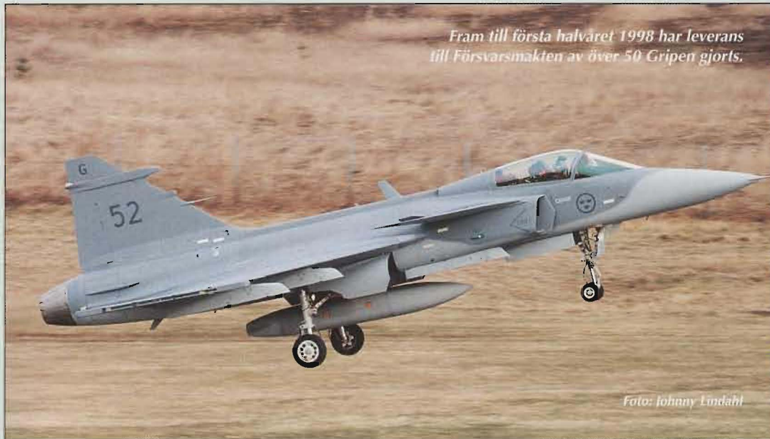
Fram till första halvåret 1998 har leverans till Försvarsmakten av över 50 Gripen gjorts.

Den kompetenshöjande utbildning som yrkes- och reservofficerare normalt ges vid krigsförbandsövningar har uteblivit pga den låga nivån på denna verksamhet. De negativa effekterna som uteblivna truppföringstillfällen får för yngre officerars funktionskunskap och förmåga har till viss del kompensats. Det har bl a skett genom andra former av repetitionsutbildning såsom lednings-