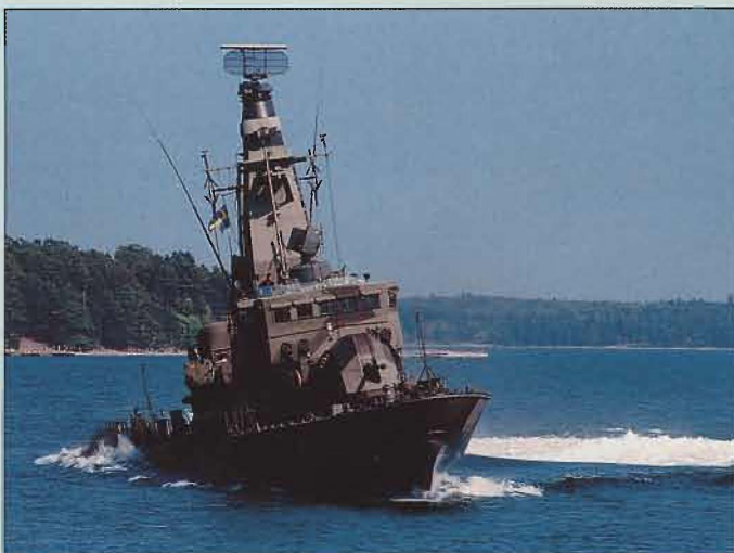
Kustkorvett vänder på en 5-öring.

Under 1997 fortsatte den omfattande, och i många avseenden genomgripande, omstruktureringen av Försvarsmaktens staber, förband och skolor. 36 enheter har lagts ner, sju enheter har organiserats och 51 enheter har omorganiserats. Under året har 993 officerare och 2.022 civila medarbetare lämnat Försvarsmakten. Antalet officerare borde ha varit cirka 1.500. Av civil personal har cirka 1.500 fått ny anställning i Fortifikationsverket. I den fortsatta omstruktureringen är det absolut nödvändigt att komma till rätta