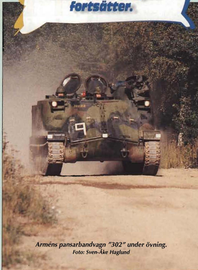
Arméns pansarbandvagn "302" under övning.

Talande siffror: 36 enheter har lagts ned. 51 har omorganiserats. 993 officerare och 2.022 civila har lämnat försvaret. Omstruktureringen fortsätter.